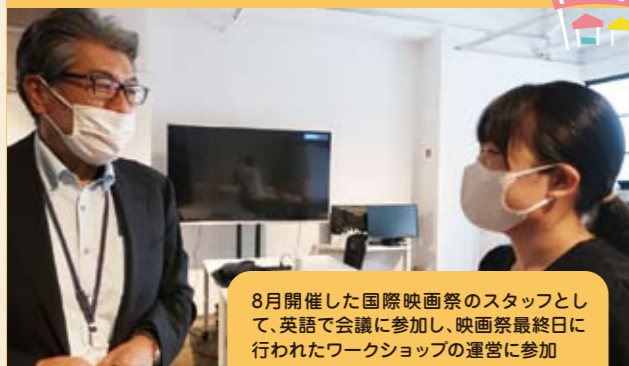
8月開催した国際映画祭のスタッフとして、英語で会議に参加し、映画祭最終日に行われたワークショップの運営に参加

参加者の声 地元である長野が世界のつながりの場になっていることに驚いた。イベントの裏側まで見たり参加できたりとても学びが多かった。