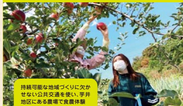
持続可能な地域づくりに欠かせない公共交通を使い、芋井地区にある農場で食農体験

参加者の声 地域の課題を考えるきっかけになった。また、活動中は子どもたちが大人と一緒に農業を楽しむ姿が見られ、とても嬉しかった。このような農業を通じた輪が広がってほしいと思った。