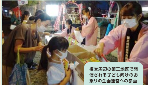
権堂周辺の第三地区で開催される子ども向けのお祭りの企画運営への参画

参加者の声 ボランティア初参加! 企画を考えたりお祭りの準備をしたり、いろいろな人との交流も普段では出来ないことで、良い経験になった。