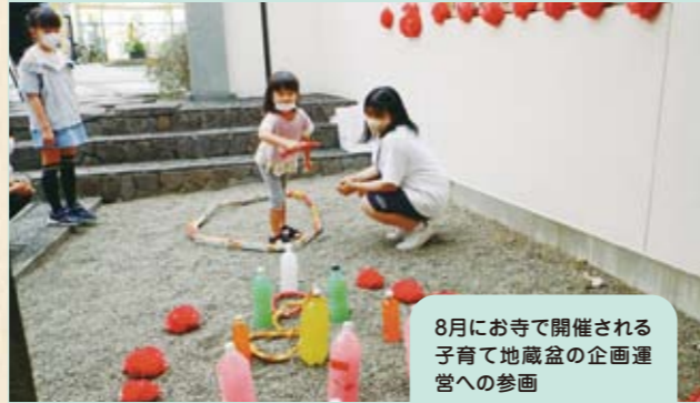
8月にお寺で開催される子育て地蔵盆の企画運営への参画

参加者の声 お寺の中という普段あまり入れない場所で活動ができ、受け入れ先や他の参加者といろいろな話をしながら交流できた。活動終了後も関係が続き、人脈が広がった。