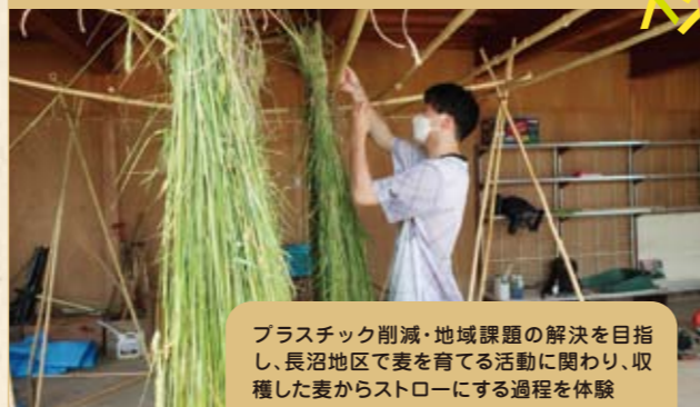
プラスチック削減・地域課題の解決を目指し、長沼地区で麦を育てる活動に関わり、収穫した麦からストローにする過程を体験

参加者の声 社会課題に関心をもつきっかけになった。自分が住んでいる地域以外の活動に出会えるいい機会だと思った。