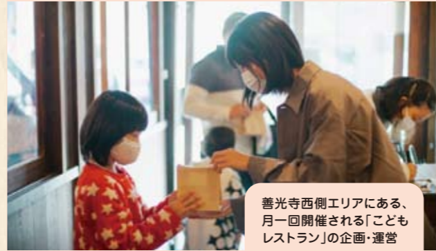
善光寺西側エリアにある、月一回開催される「こどもレストラン」の企画・運営

参加者の声 外に出て、活動することで前より自分に自信がいた気がする! いろんな人とのつながりができて本当によかった